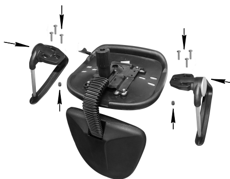
Рис.3 Крепление подлокотников Нептун