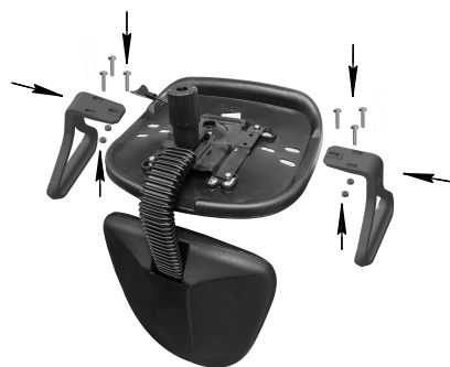
Рис.2 Крепление подлокотников Самба