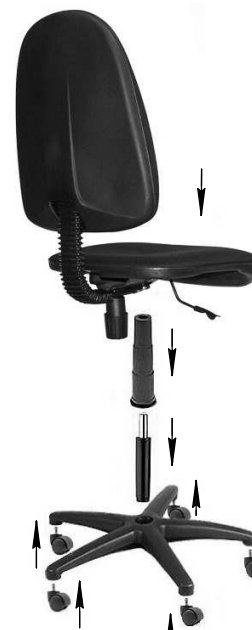
Рис.4 Сборка кресла